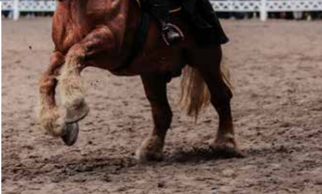
Ogier Hirfel pokazy konne Kętrzyn